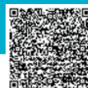
Video Turf Tips

Sosteniamo le tue vendite con una robusta produzione di newsletter, blog, social, video Turf Tips, video clip prodotto, guide pratiche da guardare, scaricare e usare. La turf community di ICL aumenta in modo costante e l'autorevolezza di ICL diventa la tua.