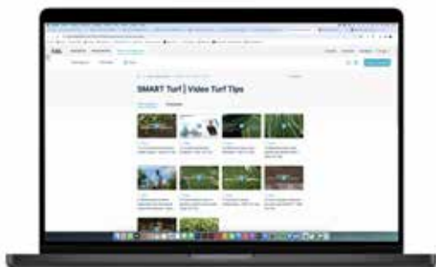
Playlist Video Turf Tips e clip di prodotto

Una grande brand recognition nel mercato del verde.