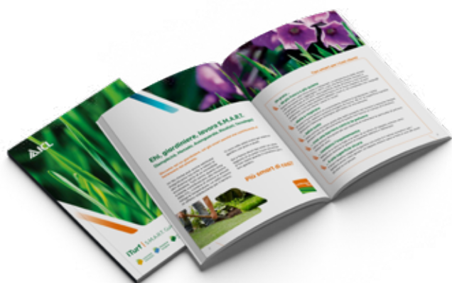
SMART Guide migliaia di downloads