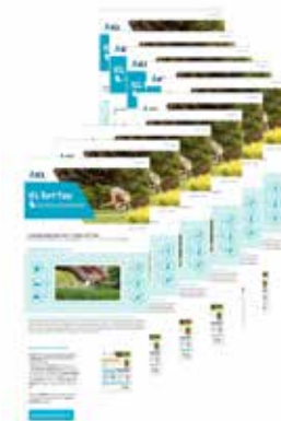
Newsletter mensile (+del 30% di open rate)