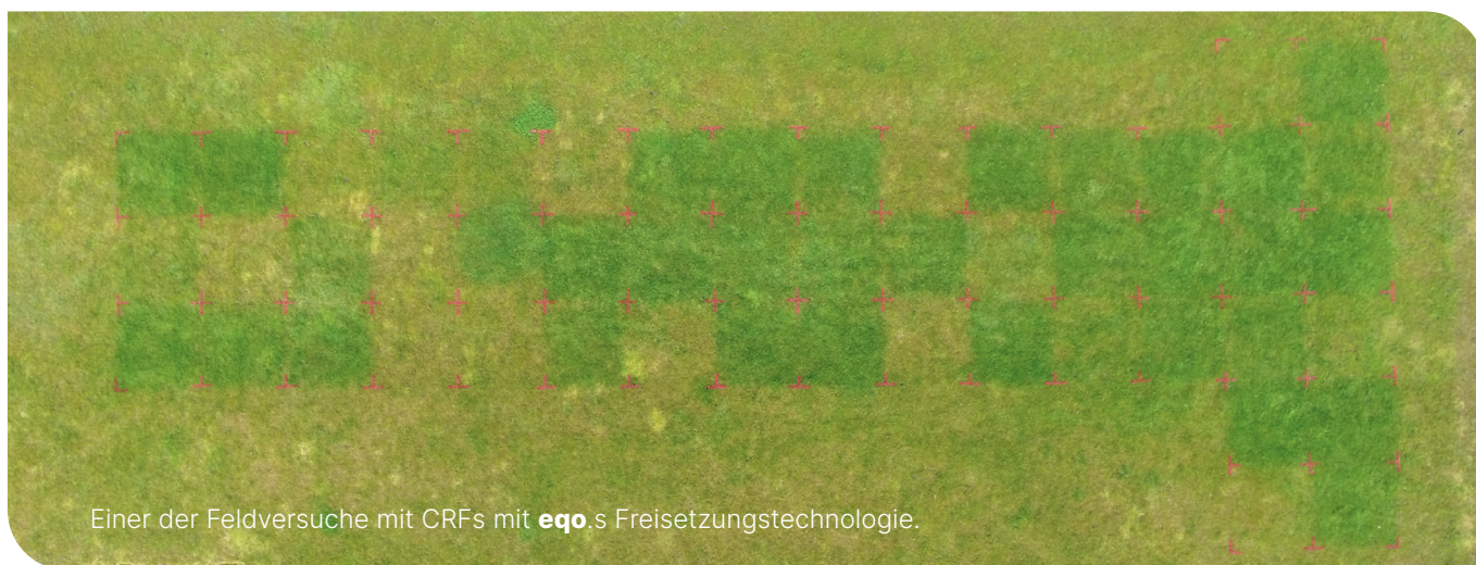
Einer der Feldversuche mit CRFs mit eqo.s Freisetzungstechnologie.